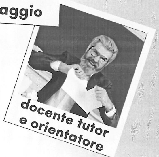
docente tutor e orientatore