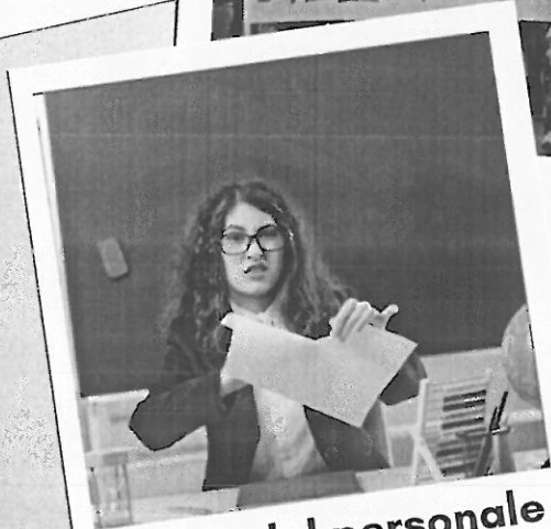
Salario del personale della scuola